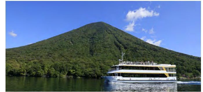
男体山と新型船「男体」