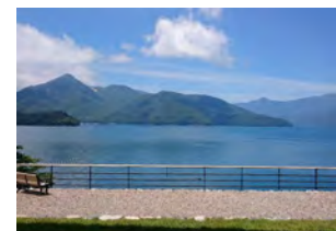
英国大使館別荘からの眺望