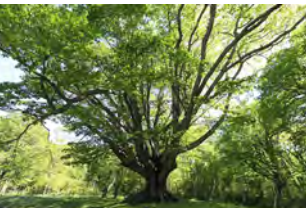
千手ヶ浜から西の湖までの原生林